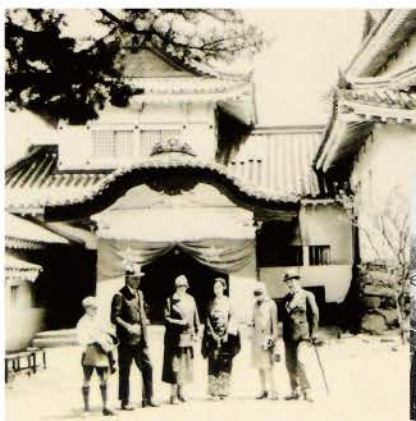
◀和歌山城天守閣を訪れたバッソンピエール一家と頼貞夫妻