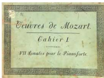
▲W. A. モーツァルト作品全集 第1巻 1798年