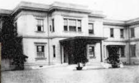
▲徳川頼貞邸本館正面玄関 (「新住宅譜」1919より)