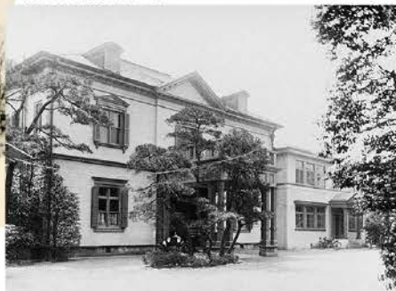
▼麹町のベルギー大使館（ジョサイア・コンドル設計）戦災で焼失した。