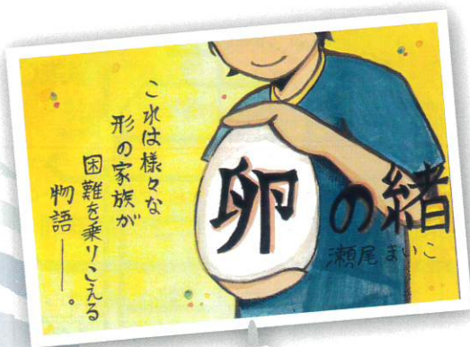
(最優秀賞・中学生の部)