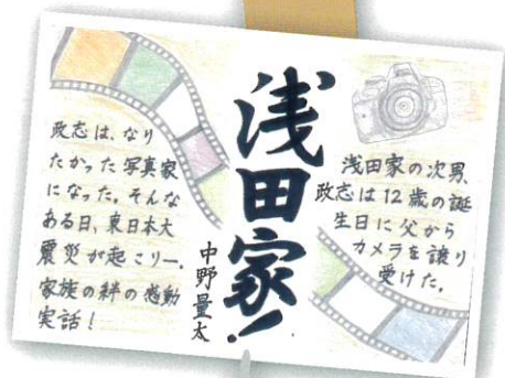
(優秀賞・中学生の部)