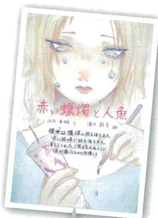
(優秀賞・高校生の部)