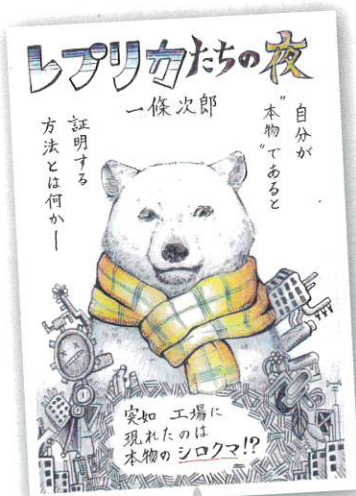
(最優秀賞・高校生の部)