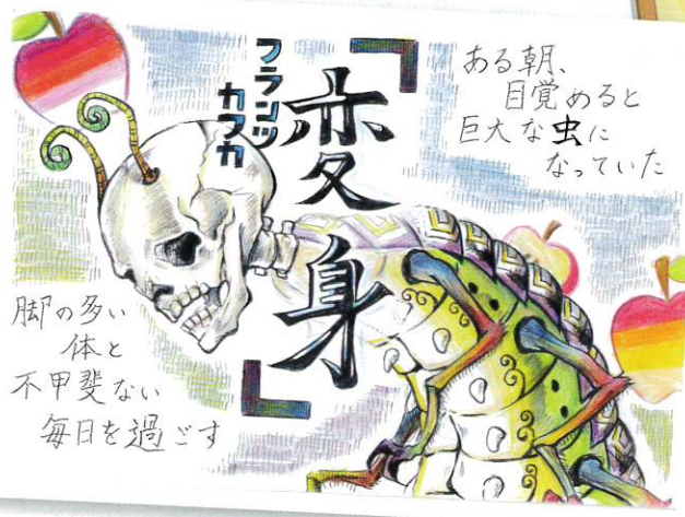
(最優秀賞・高校生の部)