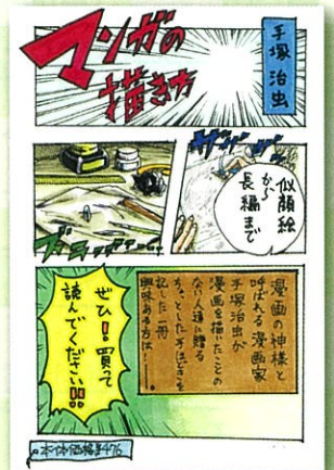
（優秀賞・高校生の部）