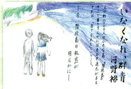
（優秀賞・中学生の部）