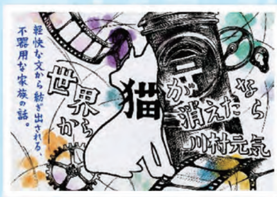
(優秀賞・高校生の部)