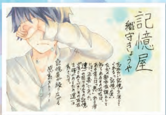
(優秀賞・中学生の部)