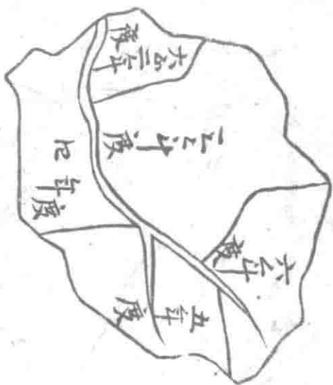
池 茶 豫 定 圖