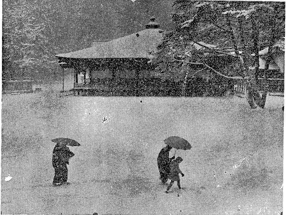
推薦 雪の日の御影堂

【別科生】 募集人員三十五人（園芸科二十人、果樹園芸科十人、分場十人） 【試験】 三月三日、面接と身体検査は同日に行なう。